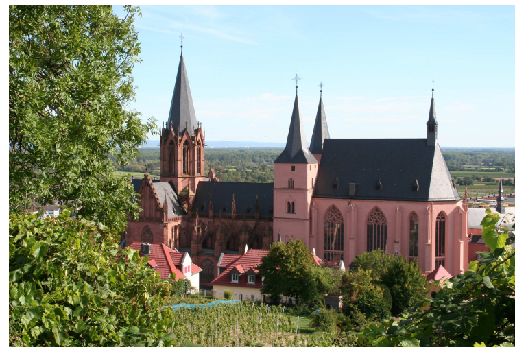
Fotoexkursion 2011 nach Oppenheim

F O T O C L U B D R E I E I C H Arbeitsgemeinschaft der Volkshochschule Dreieich VHS